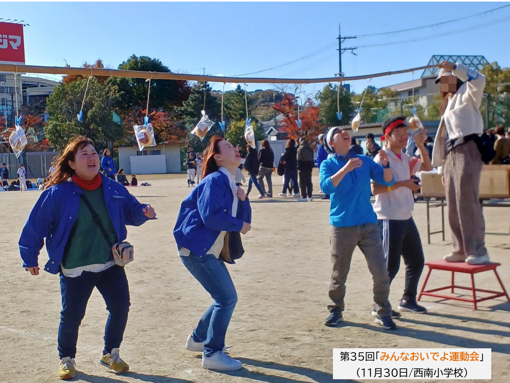
第35回「みんなおいでよ運動会」 (11月30日/西南小学校)